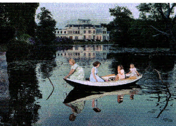
Orfeo ed Euridice: een jonge Beatrix en prinsesjes?