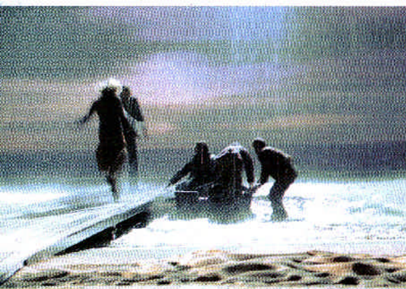
Een complete zee in Soldaat van Oranje

Orfeo ed Euridice : van 25 mei t/m 2 juli in de tuin van Paleis Soestdijk, www.deutrechtsespejen.nl Soldaat van Oranje – de musical: t/m 31 oktober in De TheaterHangaar op vliegveld Valkenburg, www.soldaatvanoranje.nl