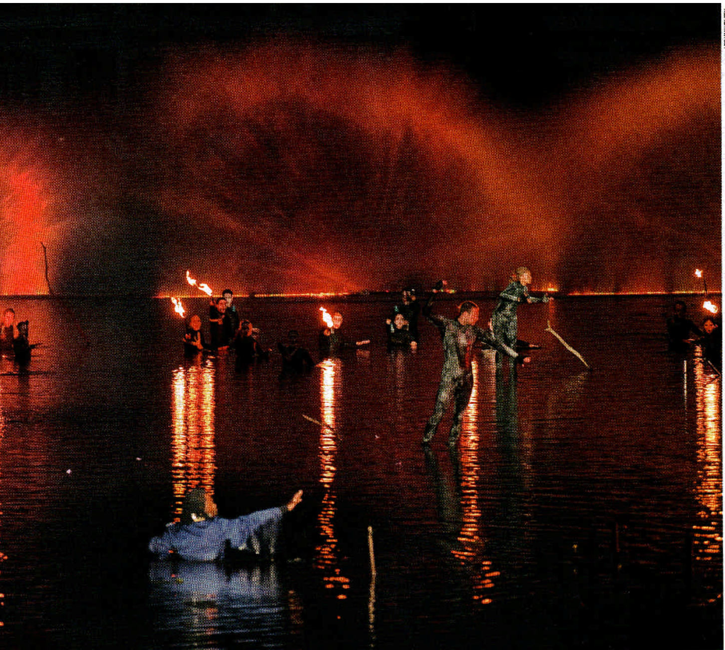
Orfeo ed Euridice van Thie en De Kimpe op locatie in de tuin en vijver van paleis Soestdijk

de verdwijning van Euridice minstens zo spectaculair. Voor die onderwaterbak bleek de koninklijke vijver niet diep genoeg. Maar het publiek, dat zelf op een ponton met tribunes in het water drijft, zal ook deze zomer worden verwonderd en betoverd met de andere staaltjes waterwerk die de voorstelling bevat: fonteinmuren als een wand naar een andere wereld, brandend water, en zangers die het oppervlak op magische wijze bedwingen.